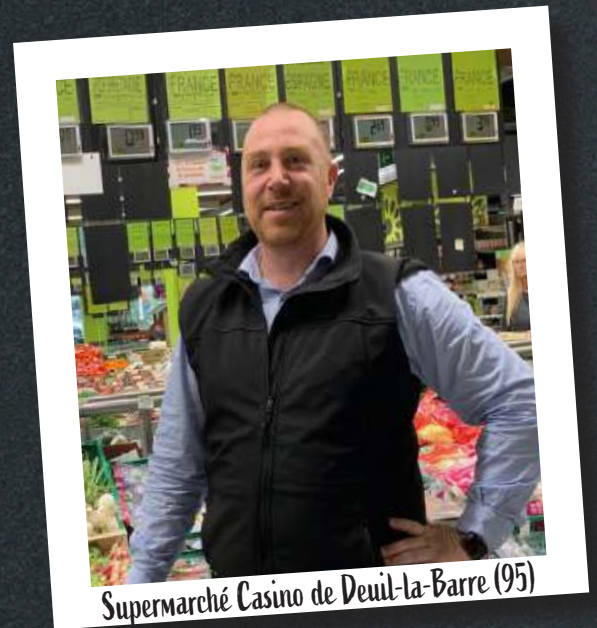
Supermarché Casino de Deuil-la-Barre (95)

« J'ai choisi la location-gérance car cette formule permet de se tester dans la gestion d'entreprise. J'avais déjà la conviction de vouloir devenir chef d'entreprise, mais il me manquait la confirmation que cela était réalisable. C'est donc un bon équilibre entre la part de risque et l'engagement personnel. Les premiers résultats économiques sont encourageants. J'ai appris beaucoup de choses sur la façon de gérer un magasin, une entreprise. Mon projet serait d'acquérir un fonds de commerce. Je souhaite devenir franchisé, avoir mon propre magasin. Les trois premières années en location-gérance ont confirmé et conforté mon souhait d'être mon propre patron. »