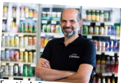
Franchisé Le Petit Casino à Toulouse (31)