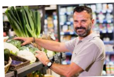
Franchisés Spar à Toulouse (31)

« Avec ma femme, nous avons racheté un SPAR à Nogaro dans le Gers, nous l'avons exploité pendant 10 ans. On voulait se rapprocher d'une grande ville, et nous avons eu l'opportunité de reprendre ce magasin. Cela fait 4 ans que nous sommes ici. Casino nous a trouvé l'emplacement, on a vraiment pu faire le magasin que l'on voulait. »